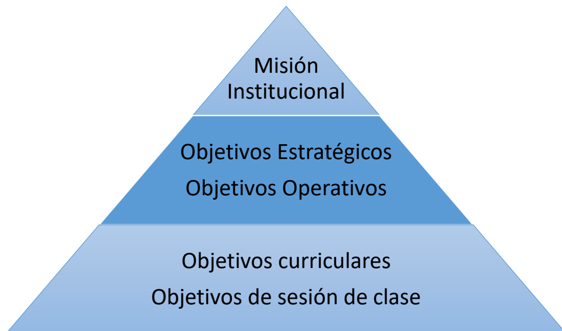
Figura 1: Jerarquía de propósitos educacionales o formativos