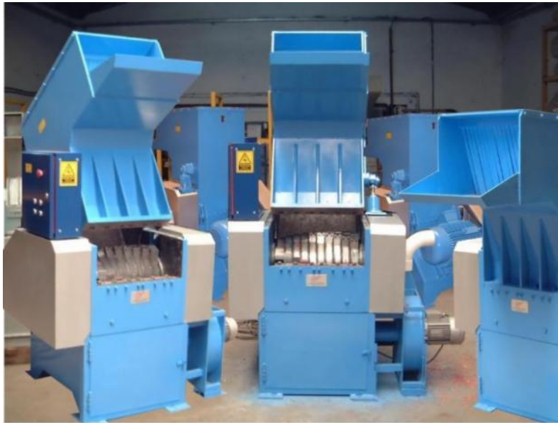
MOLINO DE PLÁSTICOS