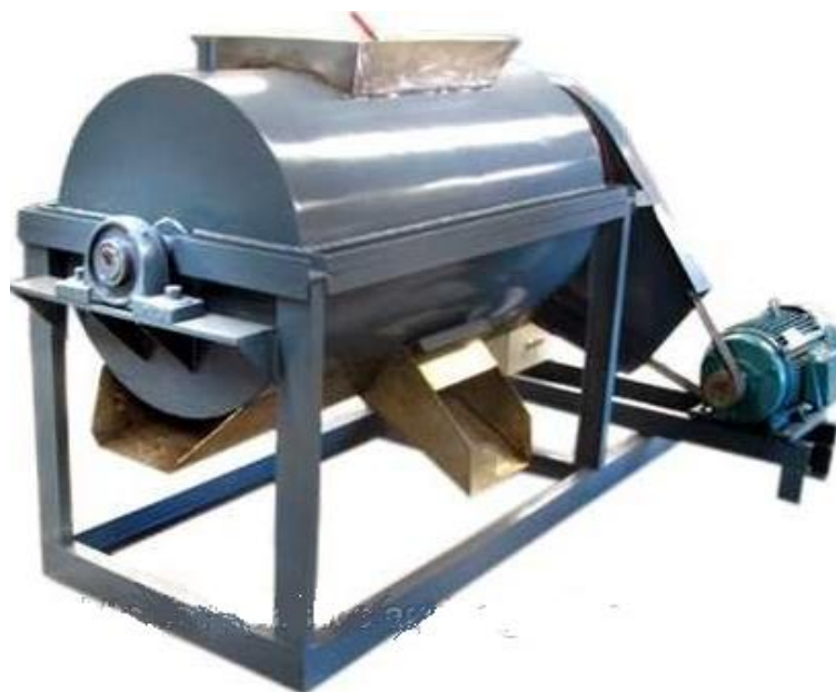
LAVADORA - SECADORA DE PLÁSTICOS