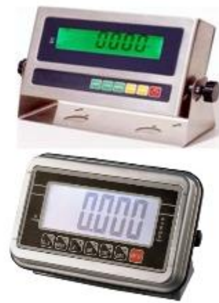
BALANZA DE RAMPA